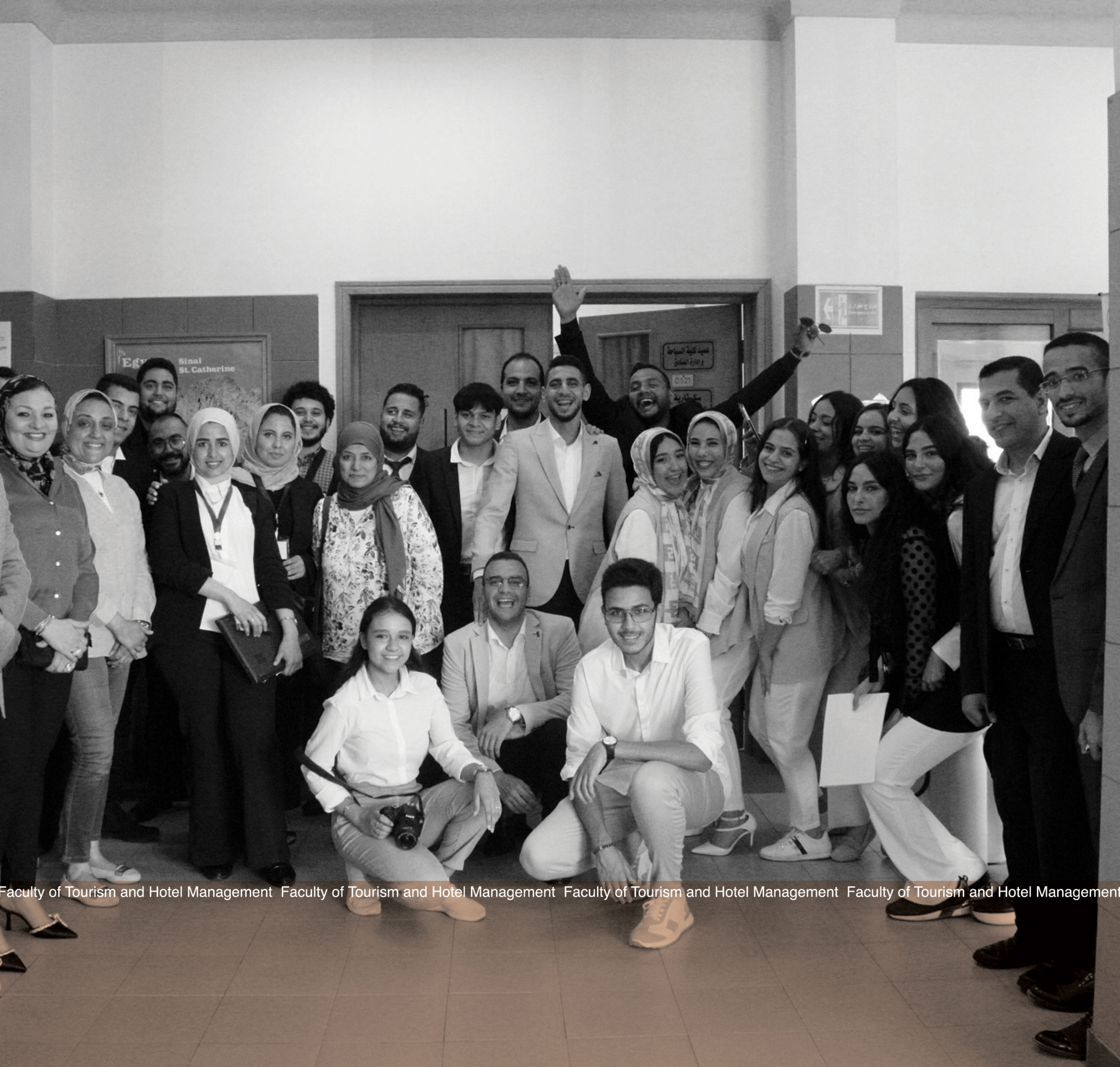
Faculty of Tourism and Hotel Management Faculty of Tourism and Hotel Management Faculty of Tourism and Hotel Management Faculty of Tourism and Hotel Management