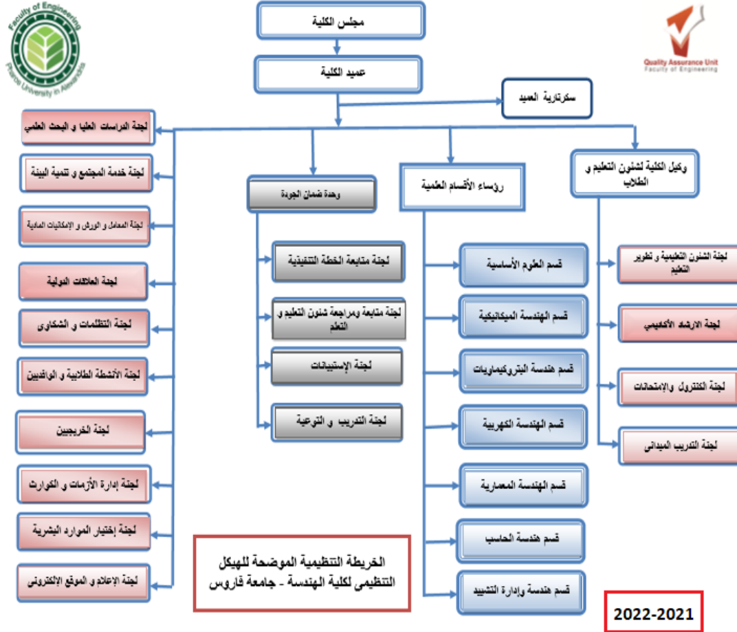
شكل-1- الهيكل التنظيمي لكلية الهندسة

حاصلة على الاعتماد من الهيئة القومية لضمان جودة التعليم والإعتماد